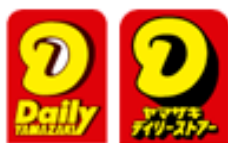
デイリーヤマザキ